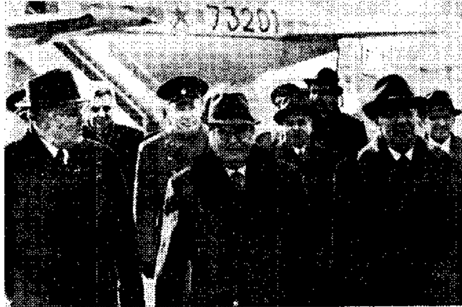
Άπό τήν έπισημήν φωνητικήν επικοινωνία του στρατηγόυ Τίτο χέει εις τό αεροδρόμιον του Κίεβου...