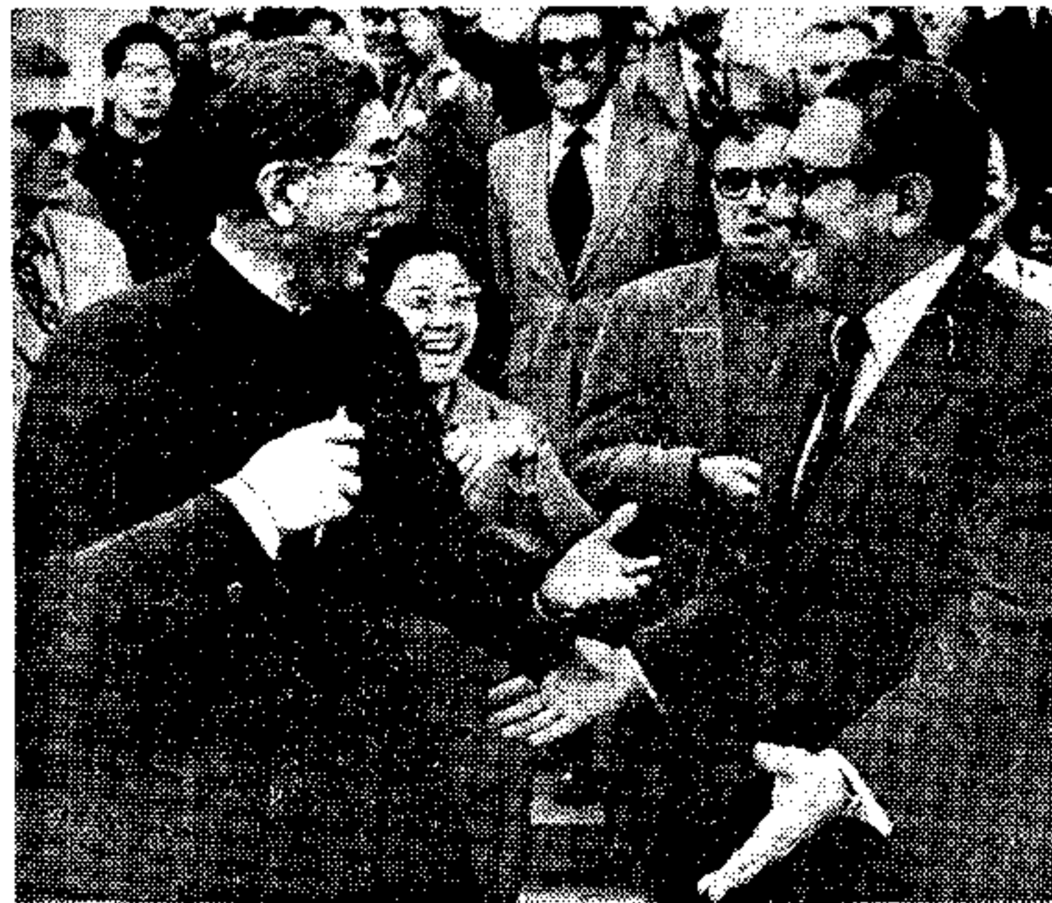
Ο Αμερικανός υπουργός Ήξαστηρ κ. Κίσιγγκερ (δεξιά) κατά την πρόσφατη επίσκεψήν του στην Αθήνα...